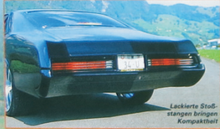
Lackierte Stoßstangen bringen Kompaktheit