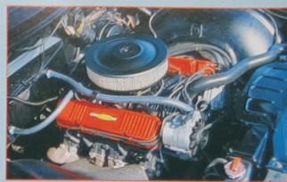
Hier wurde zwar kein Chrom-Zubehör Katalog verbaut, aber der 430er Big Block geht wie Sau